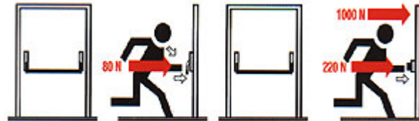
Prüfung A: Tür ohne Vorlast